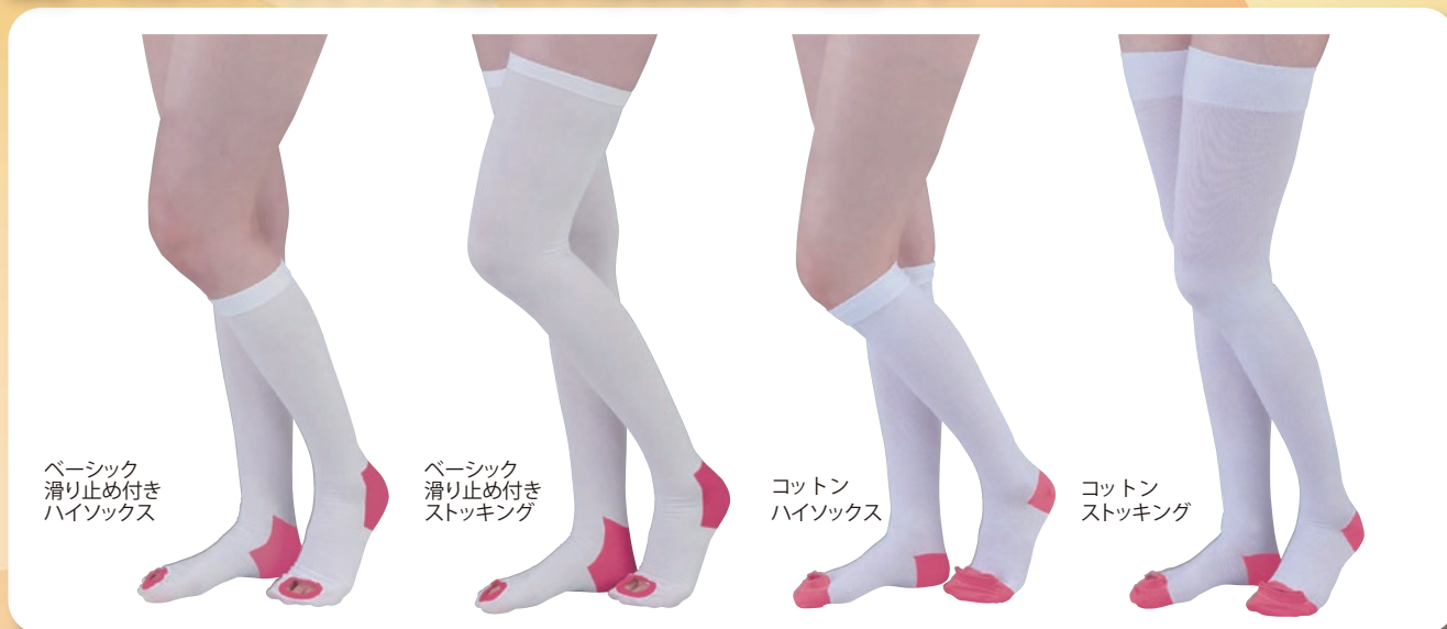
ベーシック 滑り止め付き ハイソックス