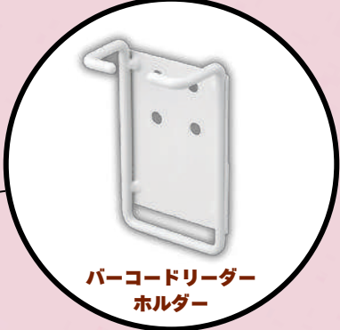
バーコードリーダーホルダー