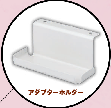
アダプターホルダー