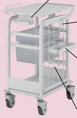
オプション取付け時