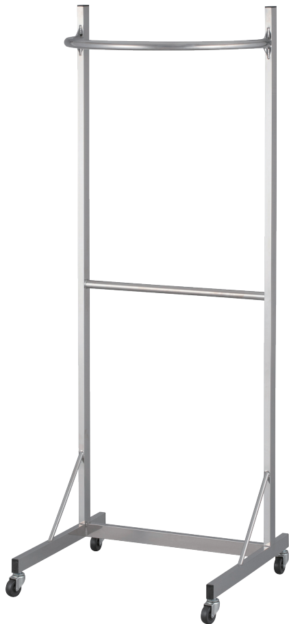
ハンガーパイプ部