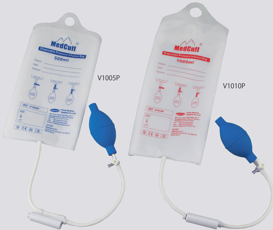
ディスポーザブル