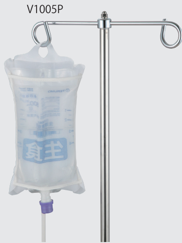
裏面はメッシュ仕様