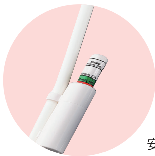
安全弁付きで過剰加圧を防止