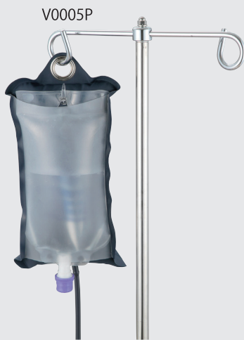
裏面は半透明のシート仕様