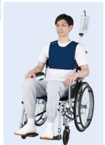
車いす対応モデル使用例 (着用時に補助必要)