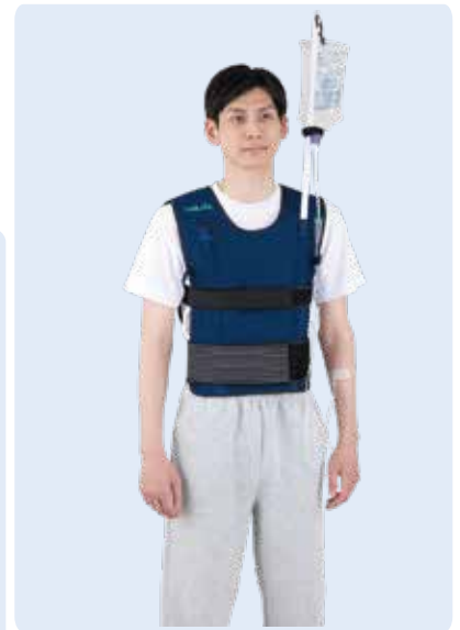
通常モデル使用例 (一人で着用可能)