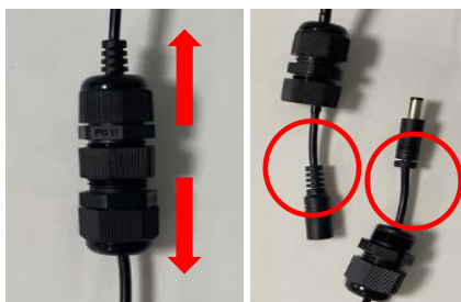
断線が発生しやすい箇所

⇒上部配線と電源コードを連結する部位において下図の通り、上下方向へそれぞれに引っ張られる力により断線する場合がありますのでご注意ください。