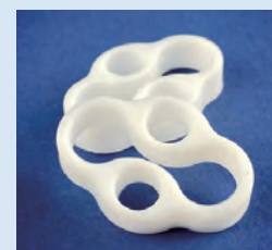
リトラクター ループ