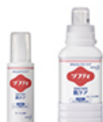
ソフティ浴用化粧料 肌ケア 120mL、400mL