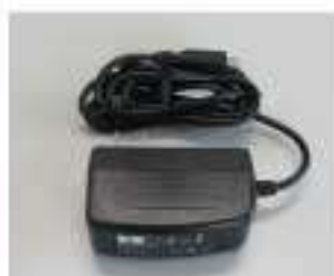
ACアダプター (付属品)