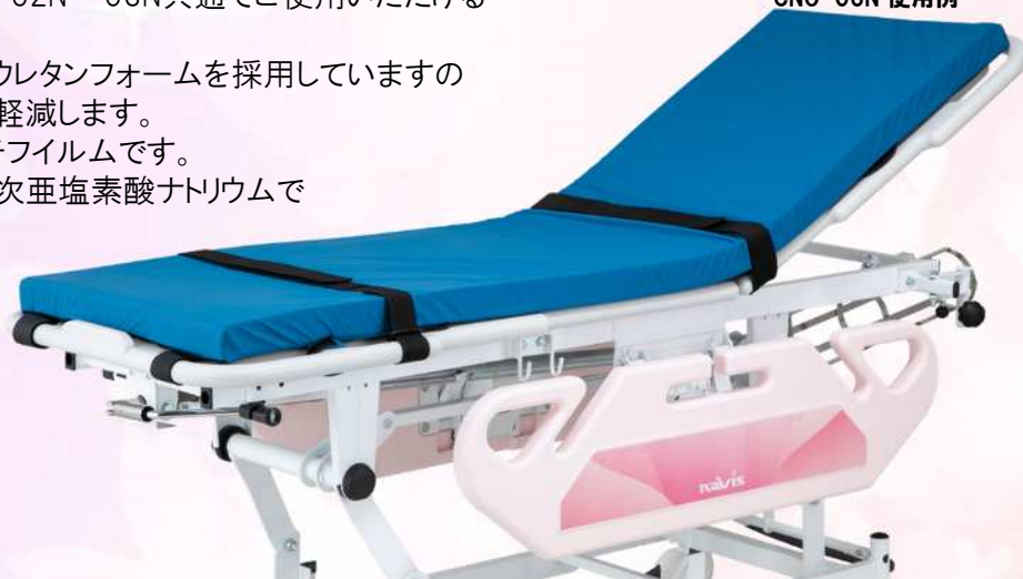
マニュアルストレッチャー CNO-03N 使用例