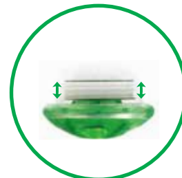
視認性の良いバルブ