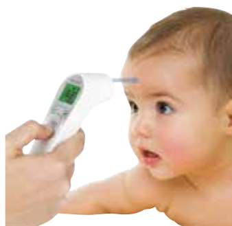
距離センサー + 青色 LED ライト