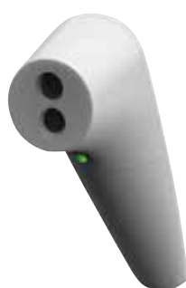
自己測定補助ライト