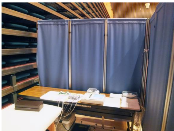
巡回健診時の間仕切として…