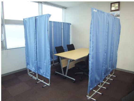
事務所の間仕切として…