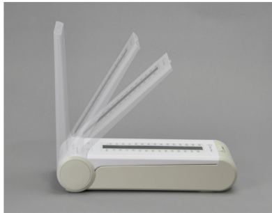
角度調整可能 90°、60°、45°と角度調整ができ、見やすい角度に設定可能