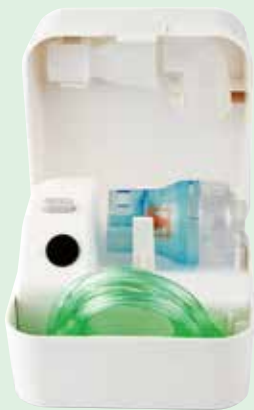
本体にネブライザーキットを収納できます