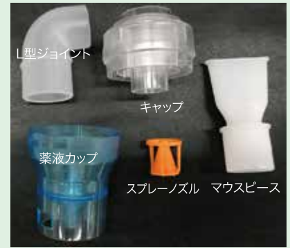
交換用ネブライザーキット内容