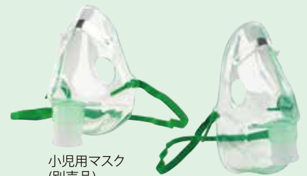
小児用マスク (別売品)