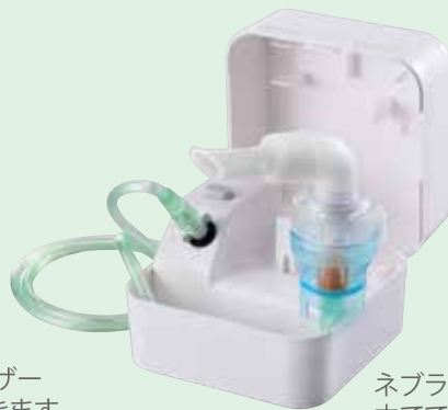
ネブライザーキットを本体に立てて使用することも可能です