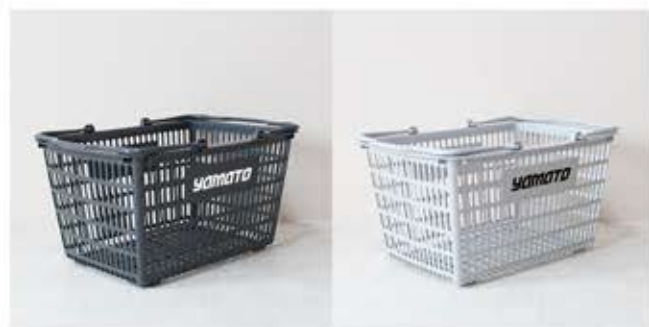
SL-8 ダークグレー (印刷色: 白)