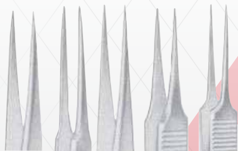
AB501/01 AB501/02 AB501/03 AB501/04 AB501/05