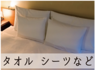
タオル シーツなど