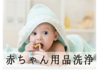
赤ちゃん用品洗浄

使用例: テーブル・イスまわり・床や壁・手すりなど・お風呂やトイレまわり・洗面台やキッチンまわり・タオルやシーツ・衣類・車イスや松葉杖など・介護用品・赤ちゃん用品・ステンレス製品・ペット及びペット用品など