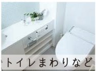
トイレまわりなど