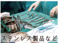
ステンレス製品など