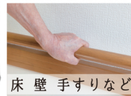
床 壁 手すりなど