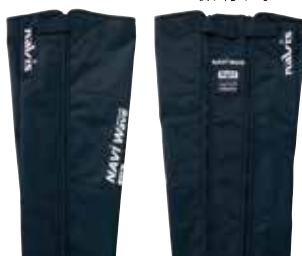
ブーツエクspander取り付け時