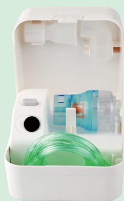
本体にネブライザーキットを収納できます