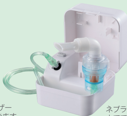
ネブライザーキットを本体に立てて使用することも可能です