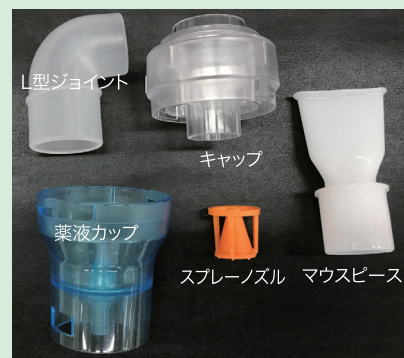
交換用ネブライザーキット内容