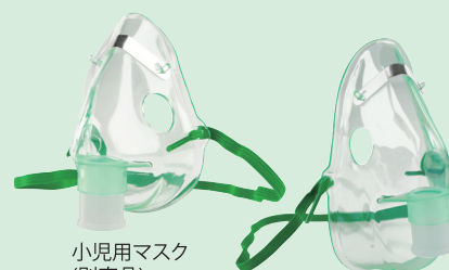
小児用マスク(別売品)