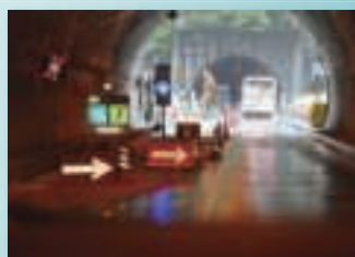
共同溝、洞道、工事現場