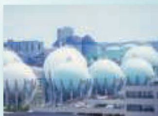
石油精製工場/ 石油化学基礎製品工場