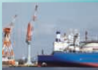
船舶、オフショア設備