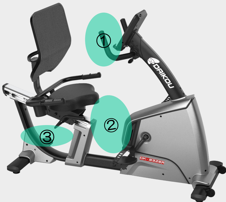
②広々とした足元空間