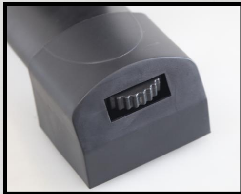
ガタツキ防止アジャスター