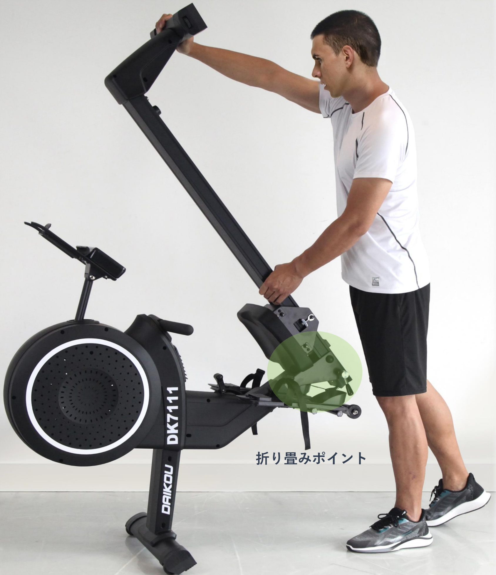
折り畳みポイント