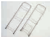
・サイドフレーム…2 (1つは まな板立て 付き)