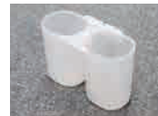
・水切りポケット…1