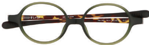
C-3 カーキマット / ブラウンデミマット