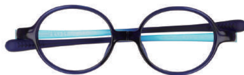
C-2 ネイビー / アクアマット