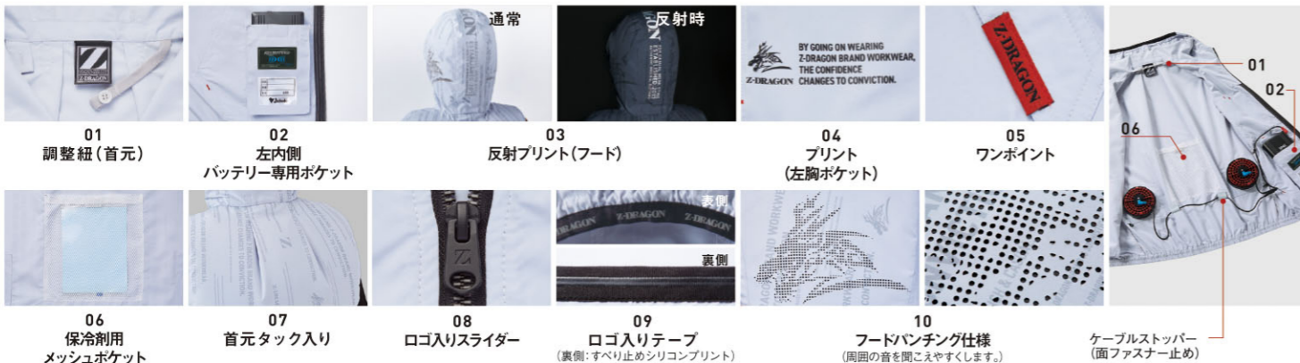
01 調整紐(首元) 02 左内側バッテリー専用ポケット 03 反射プリント(フード) 04 プリント(左胸ポケット) 05 ワンポイント 06 保冷剤用メッシュポケット 07 首元タック入り 08 ロゴ入りスライダー 09 ロゴ入りテープ(裏側:すべり止めシリコンプリント) 10 フードバンチング仕様(周囲の音を聞こえやすくします) ケーブルストッパー(面ファスナー止め)