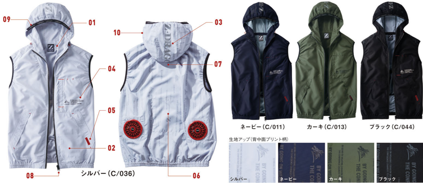
ネイビー (C/011) カーキ (C/013) ブラック (C/044)

商品説明動画はこちら パソコン、スマートフォン、 タブレットからも動画を ご覧いただけます。 ※通信費はお客様のご負担となります。