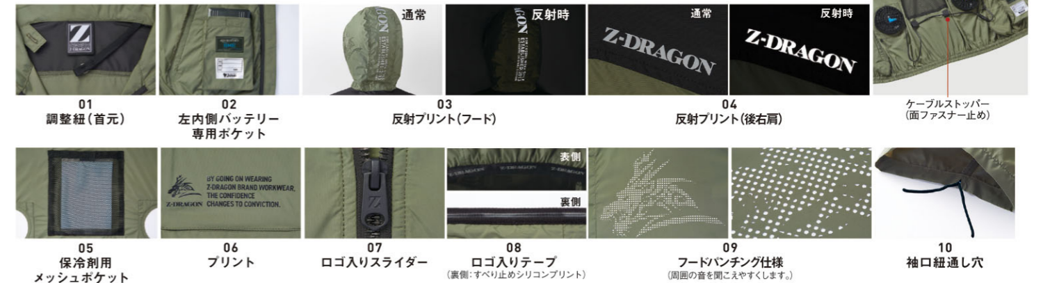
01 調整紐(首元) 02 左内側バッテリー専用ポケット 03 反射プリント(フード) 04 反射プリント(後右肩) 05 保冷剤用メッシュポケット 06 プリント 07 ロゴ入りスライダー 08 ロゴ入りテープ(裏側:すべり止めシリコンプリント) 09 フードバンチング仕様(周囲の音を聞こえやすくします) 10 袖口紐通し穴