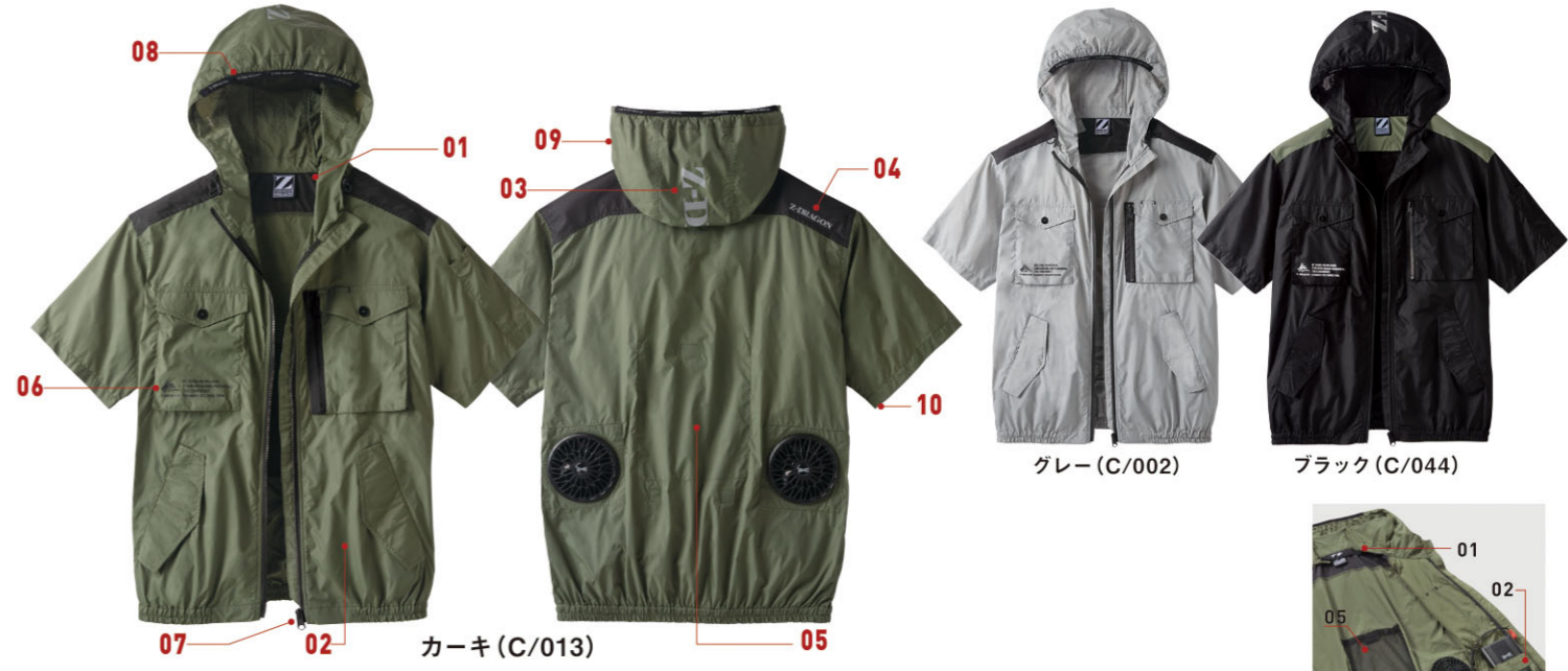
グレー (C/002) ブラック (C/044)