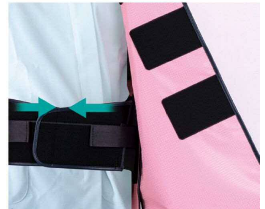
ダブルサポートベルト

ベルト位置の高さ調整が可能です。 着用する方の腰の高さに合わせてご使用ください。