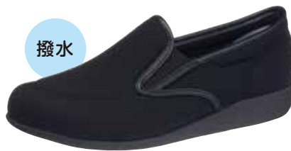
ブラックストレッチ (KS23921)