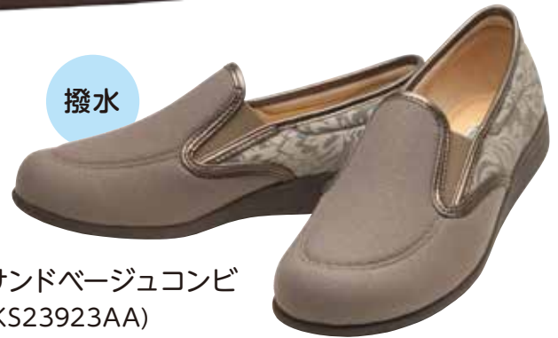
サンドベージュコンビ (KS23923AA)