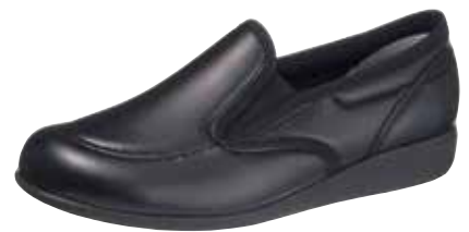
ブラックスムーズ (KS23922SM)