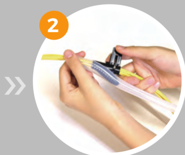
2 チューブの切れ目を挿入工具にかぶせる