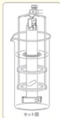
①攪拌リング止め金具 (2個で1連分)