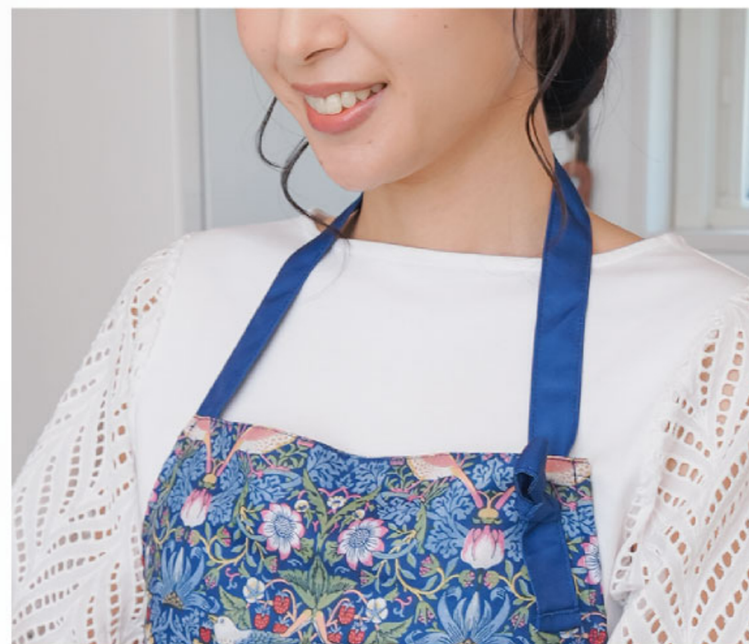
ホルターネックタイプ