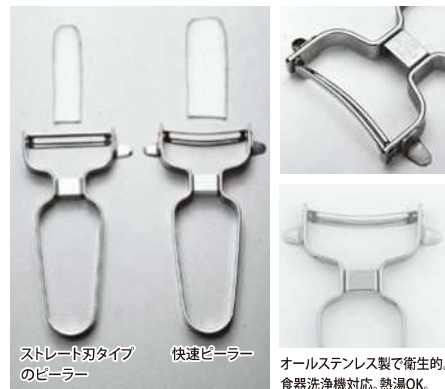
ストレート刃タイプのピーラー