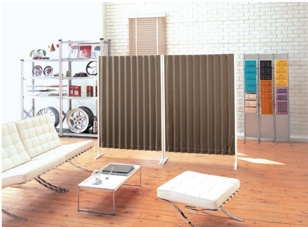
アコーディオンスクリーン Bタイプ AC-8116 アクセンテ (クレイブラウン)