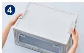
4 フタをしめてロックします。