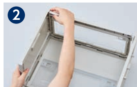
2 カチッと音がするまで押し込みます。(4か所)