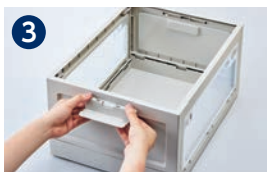
3 持ち手を取り付けます。(2か所)