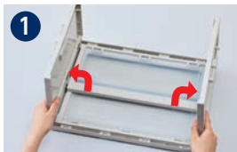
1 両側を立ち上げます。