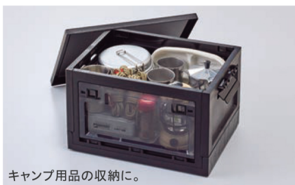
キャンプ用品の収納に。