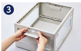
3 持ち手を取り付けます。(2か所)