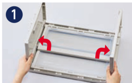
1 両側を立ち上げます。