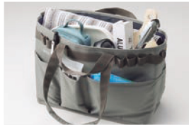
キャンプ用品を入れて。