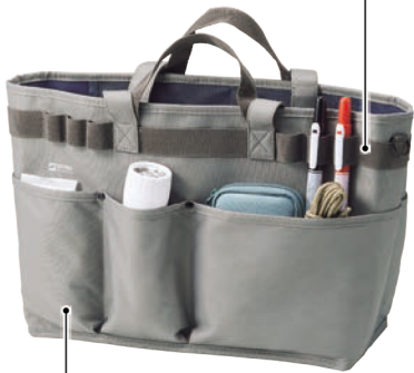
取り出しやすいアウターポケット。