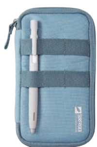
よく使うペンなどを引っかけられるベルト付き。