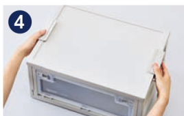
4 フタをしめてロックします。