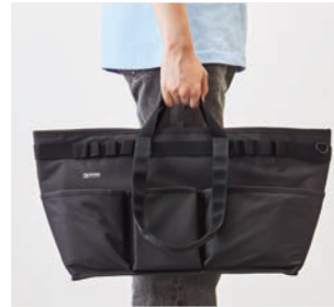
手で持つ。 ※画像はツールバッグLを使用しています。