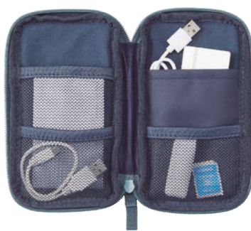
ガジェットを入れて。