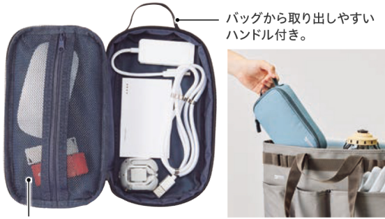
バッグから取り出しやすい ハンドル付き。