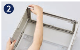
2 カチッと音がするまで押し込みます。(4か所)