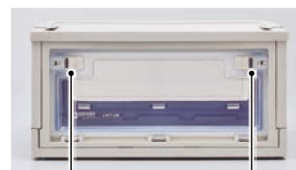
透明扉はスライドロックを左右に動かすと開閉できます。