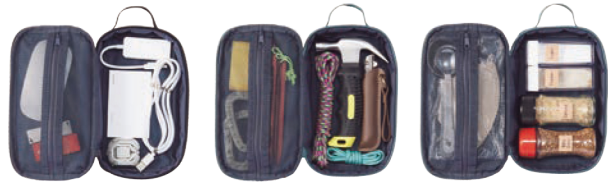
デジタルガジェットを 入れて。 キャンプ用品を入れて。 調理器具を入れて。