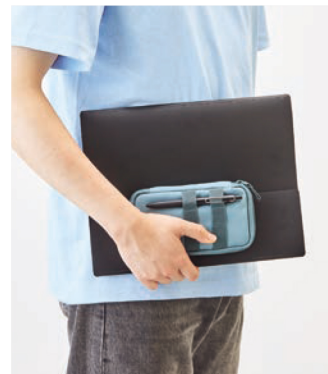
持ち運びに便利なコンパクトサイズ。