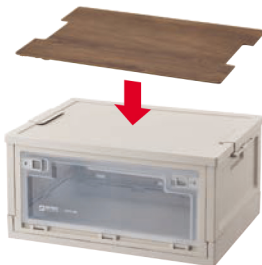
※木目には個体差があります。