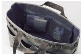
内側には仕切りファスナー ポケット付き。