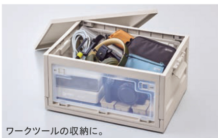
ワークツールの収納に。