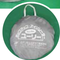
※コーナーポールを使用することで高さが変わり、座位での使用も可能に(+40cm)。

サイズ：使用時200×60×60(100)cm 収納時φ60×10cm 重さ：約3.6kg 付属品：センターポール 2本 コーナーポール 4本 (連結式) 収納袋