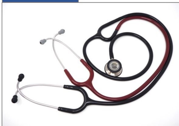
AD スコープ 703 型