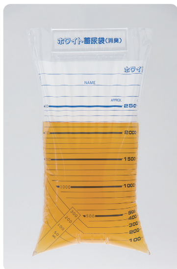
消臭・ホワイト蓄尿袋