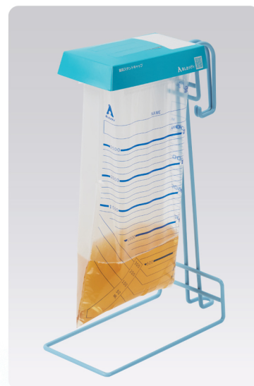
蓄尿スタンド使用例

片面を白く印刷することで、背景や隣り合った尿の色に影響されず 正確な量、色観察を可能にした消臭・ホワイト蓄尿袋と、 患者様のプライバシー保護に配慮した蓄尿袋(プライバシー保護)の 2種類をご用意しています。