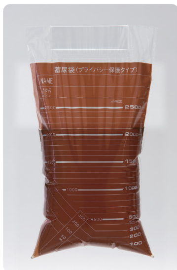
蓄尿袋(プライバシー保護タイプ)