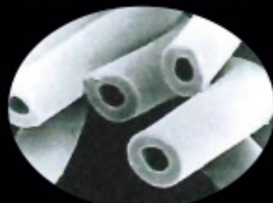
一般中空ポリエステル