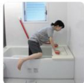
バスボードで身体を支えながら浴槽に入ります。