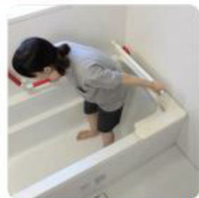
手すりにつかまって立ち上がり、バスボードをはねあげます。