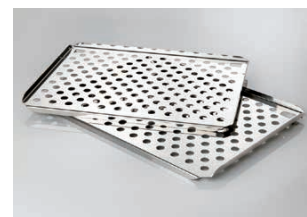
棚板 パンチタイプ

* 50127766、50127743、50126667 は IMP180 でも使用いただけます。