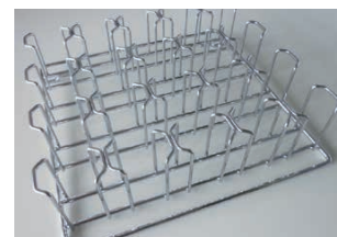
ペトリディッシュホルダー (50 mm)