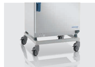
サポートスタンド