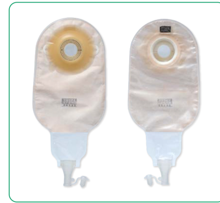
セルケア®1・Ds キャップ Cellcare1-Ds Cap