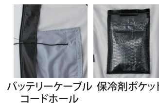
バッテリーケーブル 保冷剤ポケット コードホール

※チタン加工の特性上、摩擦や洗濯に弱く、チタンの脱落の恐れがございます。詳細はP128をご覧ください。※この製品に漂白剤(塩素系、酸素系)は絶対に使用しないでください。※ファン/バッテリーは別売です。詳細はP.86~93をご覧ください。※ご使用上の注意(P.128)をよくお読みください。