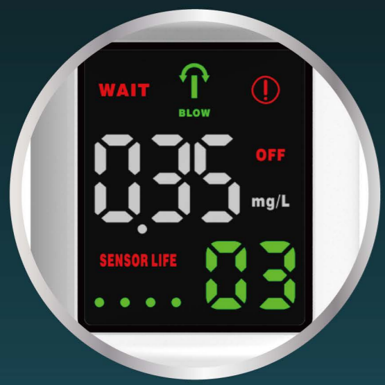
ひと目で数値がわかる デジタル表示