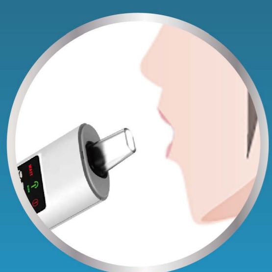
約5~10秒 吹きこむだけ