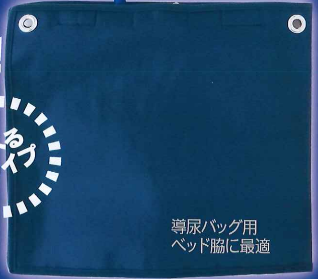
導尿バッグ用 ベッド脇に最適