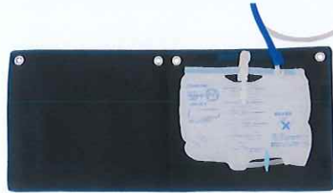
バッグをカバーで包みこむ