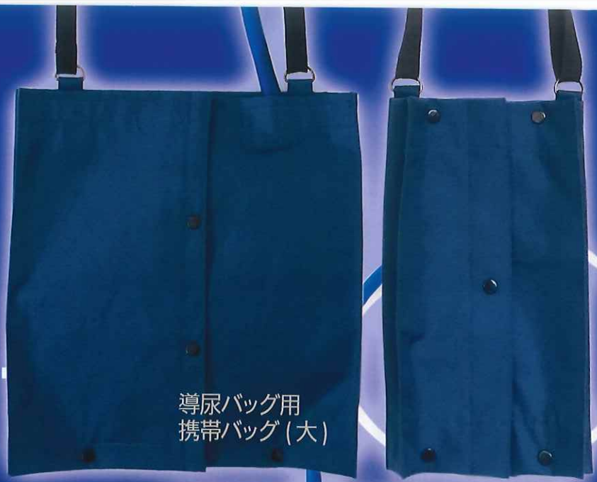
導尿バッグ用 携帯バッグ(大)