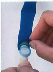
尿チューブの 入れ方