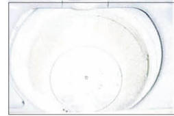
洗濯槽内面写真 全自動洗濯機10年使用

急性経口毒性試験、皮膚貼付試験、眼粘膜刺激性試験、 カビ抑制・殺菌効果試験、よごれ効果試験。 尚、本製品は、神奈川県及びホテイ産業研究所との共 同特許取得商品です。(特許 第3150299)