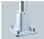
φ120用 ※アンカーボルトは別途です。