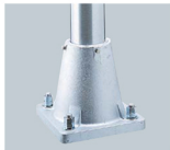
φ130用 ※アンカーボルトは別途です。