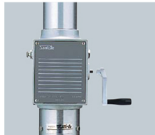
レギュレーターハンドル (付属品)