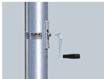
レギュレーターハンドル (付属品)