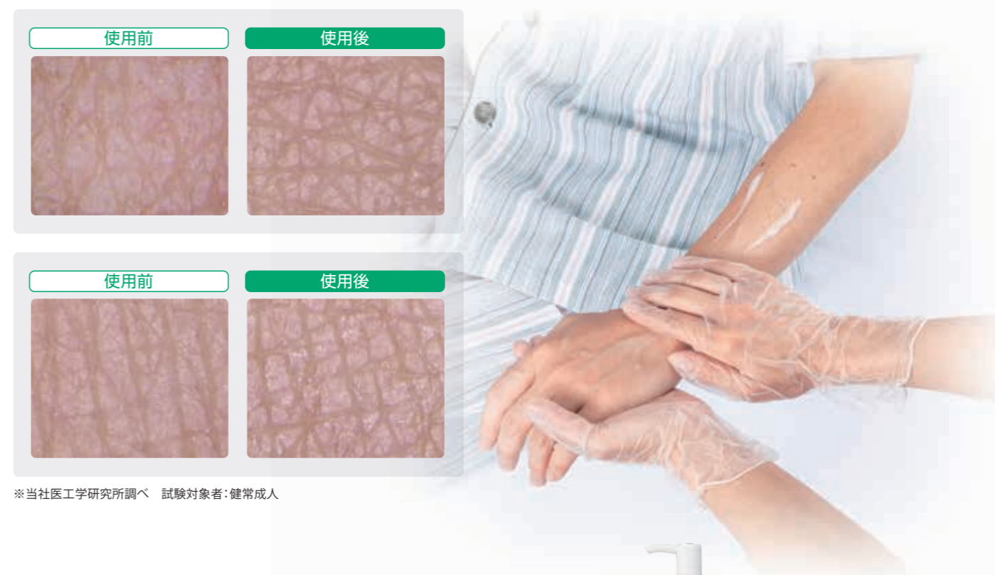
※当社医工学研究所調べ 試験対象者:健康成人

ラメラ構造化したセラミドが、より効果的に皮膚にうるおいとほろりとを与え、キメを整えます。