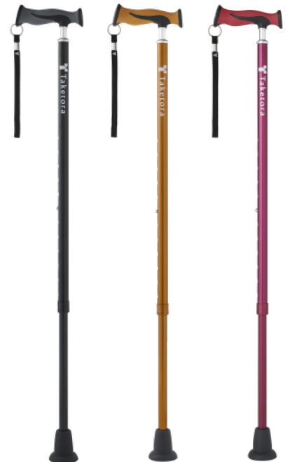
ブラック ブロンズ ワインレッド